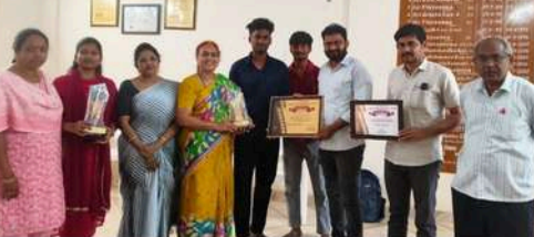
శ్రీకాకుళం, ఫిబ్రవరి 04, శ్రీకాకుళం వార్త:

సిక్కోలు లఘు చిత్రోత్సవం నరసన్నపేట డిగ్రీ కళాశాల విద్యార్థుల ఘన విజయం